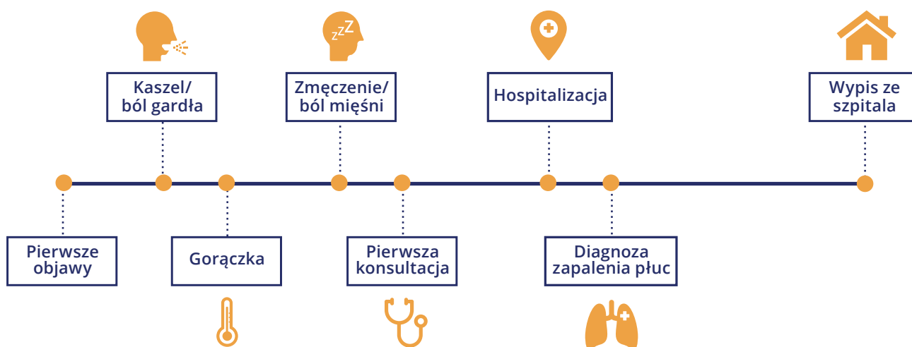
Ryc 1. Przebieg kliniczny COVID-19 w czasie.*

COVID-19 jest chorobą wywołaną przez nowy koronawirus SARS-Cov-2. Jest wysoce zakaźną chorobą obejmującą układ oddechowy, która w kolejnych etapach doprowadza do jego niewydolności, obniżenia wydolności fizycznej oraz psychicznej pacjentów. Światowa Organizacja Zdrowia (WHO) 30. stycznia 2020 r. ogłosiła epidemię, a 11. marca 2020 r. COVID-19 został określony jako pandemia [1]. Jako że jest to nowy wirus i populacja nie jest na niego odporna (nie powstała jeszcze efektywna szczepionka), ma on potencjał do szybkiego rozprzestrzeniania się. Wszyscy zatem jesteśmy narażeni na zakażenie się tym wirusem: zwykły obywatel, pacjent lub też pracownik ochrony zdrowia. Większość osób przechodzi COVID-19 łagodnie w domu bez potrzeby specyficznego leczenia, a przebieg infekcji porównywalny jest z przeziębieniem lub grypą [2]. Jednakże u 15-20% osób obserwuje się ciężki przebieg choroby, a w 2-3% przypadków dochodzi do zgonów. Najczęstszymi objawami są: gorączka, zmęczenie, suchy kaszel, duszność i ból mięśni [3]. Wraz z postępem objawów w wielu przypadkach dochodzi do zapalenia płuc [4]. Poniższy diagram przedstawia kliniczny przebieg choroby COVID-19.