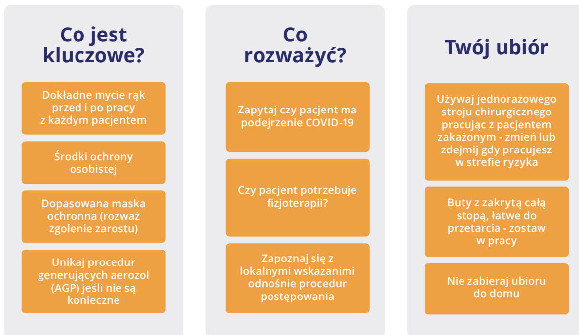
Ryc.2. Powyższy diagram przedstawia zalecenia bezpieczeństwa dla fizjoterapeutów.